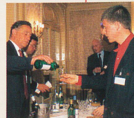
Soirée - Rencontre de dégustation de vins suisses.