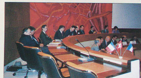
Plate-forme d'informations, elle met à la disposition de ses adhérents son savoir-faire pour trouver, à la bonne source, le renseignement recherché, défricher les questions difficiles, accompagner certaines démarches au plan local. Véritable « généraliste », elle s'appuie sur un réseau de spécialistes vers lesquels elle oriente les dossiers le nécessitant.