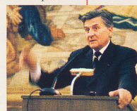
Dîner-Conférence avec M. Claude Trichet, Gouverneur de la Banque de France.

■ Rencontres professionnelles : les visites d'entreprises.