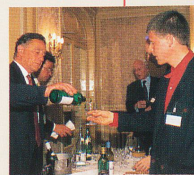
Soirée - Rencontre de dégustation de vins suisses.