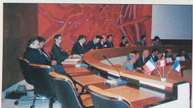
Plate-forme d'informations, elle met à la disposition de ses adhérents son savoir-faire pour trouver, à la bonne source, le renseignement recherché, défricher les questions difficiles, accompagner certaines démarches au plan local. Véritable « généraliste », elle s'appuie sur un réseau de spécialistes vers lesquels elle oriente les dossiers le nécessitant.