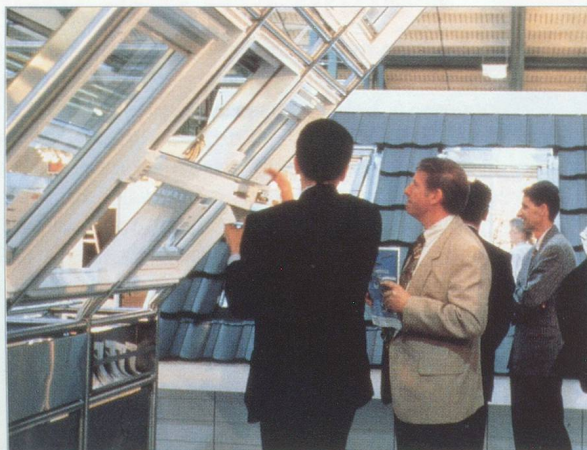
D'intéressantes présentations spéciales portant sur la construction et l'architecture enrichissent l'offre informative de Swissbau 99.