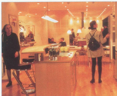
Le marché de l'information pour les architectes, les spécialistes du bâtiment comme pour les propriétaires et les artisans.

La foire de Bâle accueillera, du 2 au 6 février 1999, le salon suisse de la construction SWISSBAU. Avec près de 1000 exposants, ce salon est le plus important forum de l'industrie suisse du bâtiment et l'un des tout premiers salons de la construction en Europe. Cette année, l'accent sera particulièrement mis sur les secteurs de l'aménagement et de la domotique. 1362 exposants, venus de 30 pays, y présenteront sur 50.000 m 2 leurs dernières nouveautés dans les secteurs de l'aménagement, de la cuisine, du sanitaire, du jardinage, de la piscine, de la domotique, de la planification et de la communication. Au programme également des séminaires et conférences, ainsi que des présentations spéciales. Près de 100.000 visiteurs sont attendus. A noter que la Documentation suisse du bâtiment présentera, sur son stand E22, salle 211, une documentation complète (classeurs, CD-Rom, site Internet www.baudoc.ch ) sur l'ensemble du marché suisse de la construction. Pour tout renseignement sur Swissbau : Tél. +41 61 686 22 54 - Internet : http://www.messebasel.ch/swissbau .