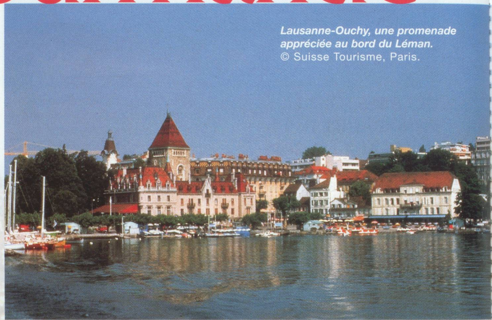
Lausanne-Ouchy, une promenade appréciée au bord du Léman.

Mini-métropole de la Romandie, siège olympique, elle est aussi le théâtre de grands congrès. Ses palaces (le Beau Rivage , le Lausanne-Palace ) ont fière allure. La vedette