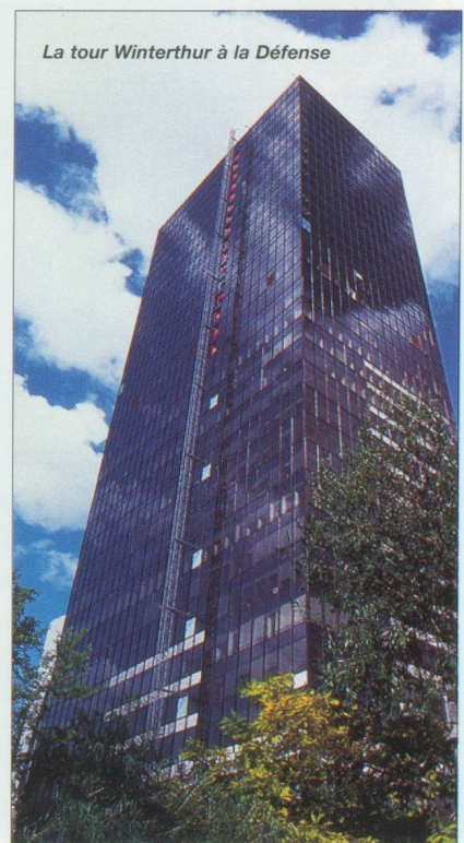
La tour Winterthur à la Défense