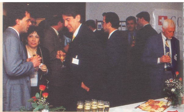
Les nombreuses manifestations de la CCSF Grand-Est rencontrent toujours un grand succès

Th.B. : Ce n'est un secret pour personne : la CCSF procède