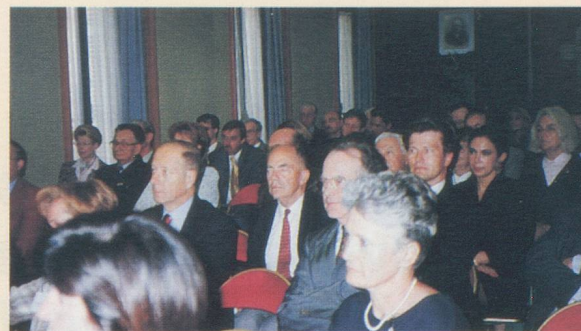
Un auditoire attentif pour les rencontres économiques.

R.C. : En organisant notamment ce que nous appelons des rencontres économiques. Elles se tiennent toujours dans nos locaux, rue d'Arcole. En 1997, l'une d'elles a été consacrée à l'euro et à ses conséquences pour la Suisse. Elle a obtenu un très grand succès puisque nous avons réuni quelque 120 personnes. Nous intervenons partout où on nous le demande. Récemment, nous sommes allés présenter la Chambre dans le cadre