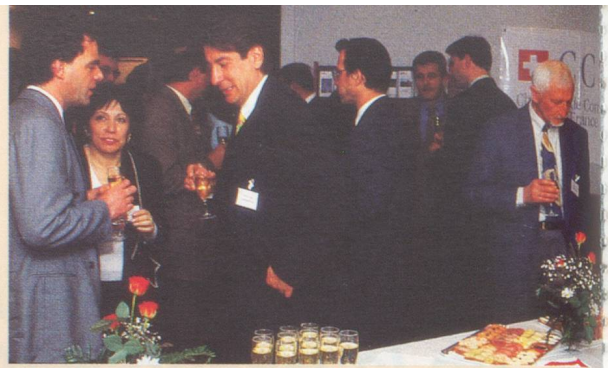
Les nombreuses manifestations de la CCSF Grand-Est rencontrent toujours un grand succès

Th.B. : Ce n'est un secret pour personne : la CCSF procède