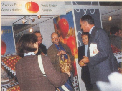
Son Exc. M. Bénédicte de Tscharnern, Ambassadeur de Suisse en France (à droite) en entretien avec l'un des exposants.

L'Office suisse d'expansion commerciale (OSEC) a organisé à nouveau cette année, en partenariat avec la Fédération des industries alimentaires suisses (FIAL), une section officielle suisse au Salon International de l'Alimentation au Parc des Expositions de Paris-Nord Villepinte, en banlieue parisienne. C'est ainsi que, du 18 au 22 octobre, plus de 20 entreprises, leaders sur le marché suisse, ont utilisé cette plate-forme scindée dans deux halls (l'un consacrée à l'alimentation et produits d'agrément ; l'autre aux fromages et produits laitiers). Les produits exposés couvraient de multiples domaines comme les aliments naturels, le fitness food, le safety food, les aliments fonctionnels et organiques ainsi qu'un grand nombre de produits prêts à l'emploi (rôsti, fondues par ex.). Son Exc. Monsieur Bénédicte de Tscharnern, Ambassadeur de Suisse en France, a visité avec beaucoup