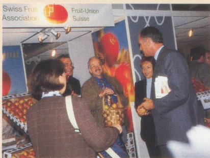
Son Exc. M. Bénédicte de Tscharnher, Ambassadeur de Suisse en France (à droite) en entretien avec l'un des exposants.

L'Office suisse d'expansion commerciale (OSEC) a organisé à nouveau cette année, en partenariat avec la Fédération des industries alimentaires suisses (FIAL), une section officielle suisse au Salon International de l'Alimentation au Parc des Expositions de Paris-Nord Villepinte, en banlieue parisienne. C'est ainsi que, du 18 au 22 octobre, plus de 20 entreprises, leaders sur le marché suisse, ont utilisé cette plate-forme scindée dans deux halls (l'un consacrée à l'alimentation et produits d'agrément ; l'autre aux fromages et produits laitiers). Les produits exposés couvraient de multiples domaines comme les aliments naturels, le fitness food, le safety food, les aliments fonctionnels et organiques ainsi qu'un grand nombre de produits prêts à l'emploi (rôsti, fondues par ex.). Son Exc. Monsieur Bénédicte de Tscharnher, Ambassadeur de Suisse en France, a visité avec beaucoup