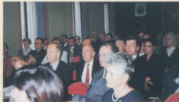
Un auditoire attentif pour les rencontres économiques.

R.C. : En organisant notamment ce que nous appelons des rencontres économiques. Elles se tiennent toujours dans nos locaux, rue d'Arcole. En 1997, l'une d'elles a été consacrée à l'euro et à ses conséquences pour la Suisse. Elle a obtenu un très grand succès puisque nous avons réuni quelque 120 personnes. Nous intervenons partout où on nous le demande. Récemment, nous sommes allés présenter la Chambre dans le cadre