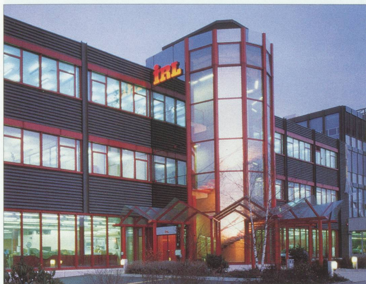
Siège des IRL, à Lausanne