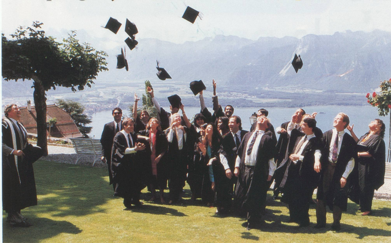
Un environnement idyllique pour des études sereines dans la bonne humeur.