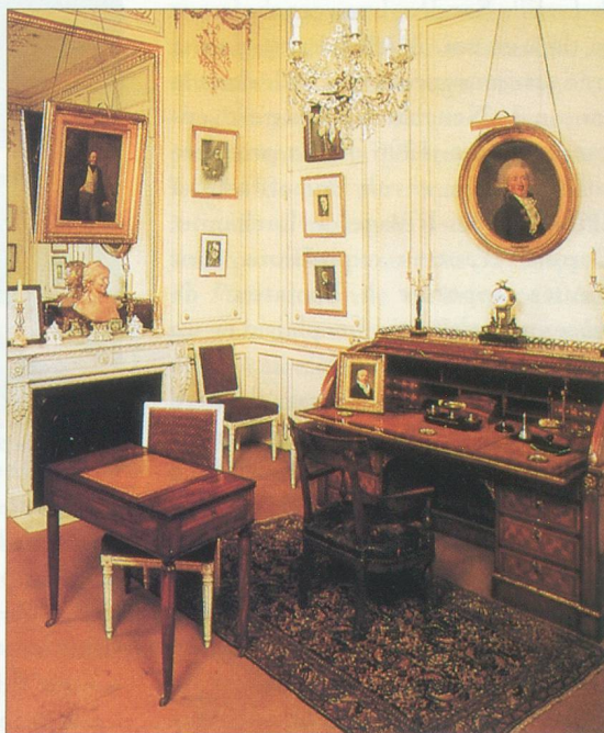
Crédit Suisse Hottinguer, Paris. Le Petit Salon.

tune, les banquiers privés sont à l'origine de ce segment de la place financière connu sous le terme générique de « banque privée » ou - comme disent les Anglo-saxons - du