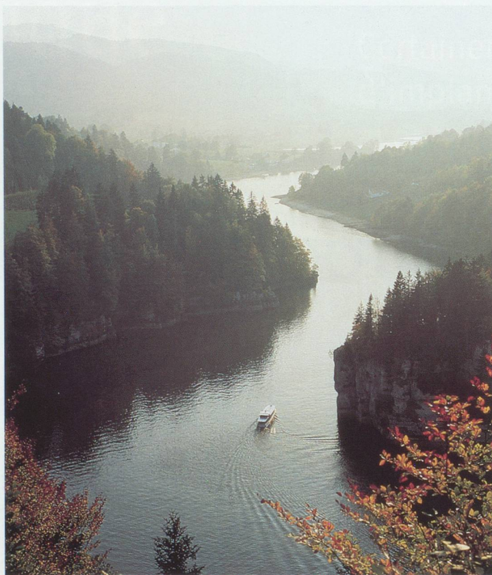
Le Doubs près des Brenets (Jura neuchâtelois).

même bien mieux que ce que les médias ou la population disent parfois. » Ces derniers mois, certains coups durs ont toutefois touché la région. Plusieurs entreprises comme Lippomatrix, Cordis et Micronas, ont annoncé leur fermeture. Elles s'étaient installées dans la région neuchâteloise en profitant de cadeaux fiscaux accordés pour faciliter leur implantation ; nombreux sont ceux qui leur reprochent de s'en aller parce qu'elles ne bénéficient plus de ces « faveurs ». Les cantons de Neuchâtel et de Berne, pour ne citer qu'eux, ont d'ailleurs donné de nouvelles impulsions à leur système de promotion économique. Berne, par exemple, s'attache à constituer des réseaux spécifiques sur des secteurs particulièrement porteurs tels l'industrie de précision, l'instrumentation médicale, la télématique, les techniques de l'environnement, le design et les activités de service. Neuchâtel, quant à lui, vient de présenter des propositions pour que la promotion économique évolue davantage en