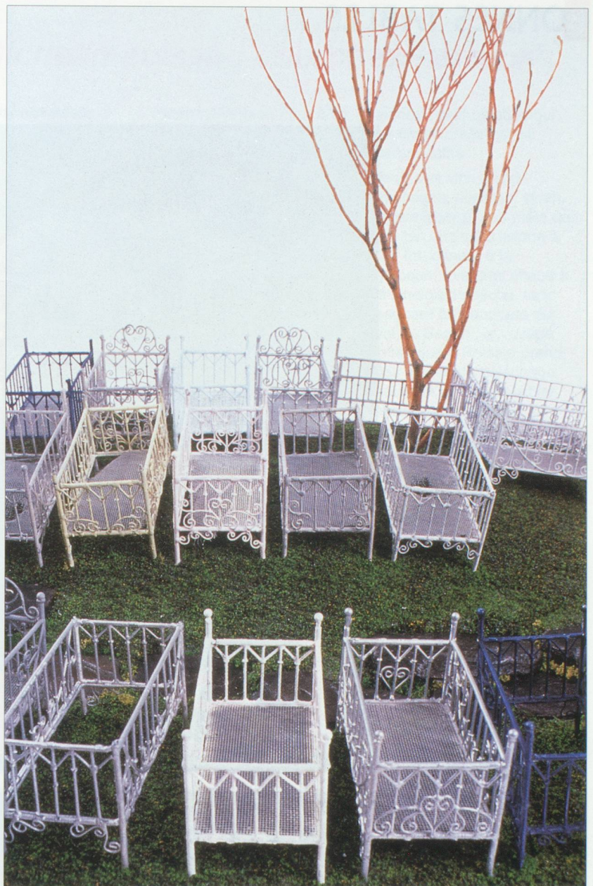
Spring Hurlbut « le jardin du Sommeil ». Projet pour Art Grandeur Nature 1998.

► Centre Culturel Suisse. Tél. : 01 42 71 44 50. Du 6 mai au 28 juin 1998.