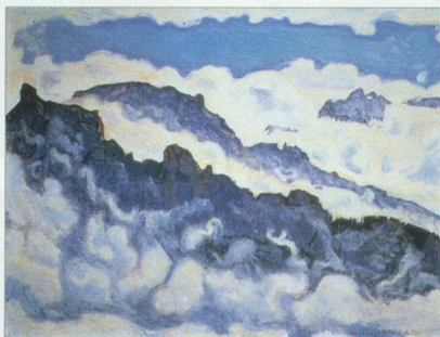
Ferdinand Hodler (1853-1918) « Brumes montantes au Wetterhorn », 1908. Kunstmuseum Soleure, Suisse.