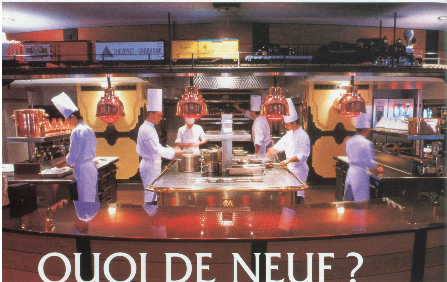
Les pianos de "L'Est", gare des Brotteaux à Lyon