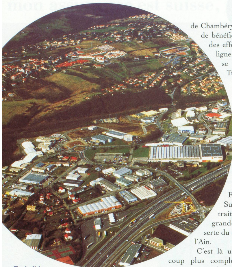
Techclid, pôles d'entreprises performantes au nord-ouest de Lyon

par la réalisation de plusieurs grands projets d'infrastructures dans la prochaine décennie. Quels sont-ils ?