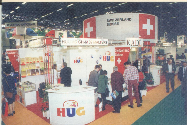
Salon International de l'Alimentation à Paris 1996 - Stand collectif suisse organisé par l'Office Suisse d'Expansion Commerciale (OSEC), Zurich.