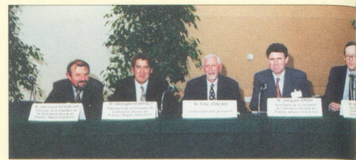
Manifestation publique de la Chambre de Commerce Suisse en France, Région Grand-Est, à Mulhouse le 23 mai 1996.

Nous vous remercions de bien vouloir nous faire connaître à vos amis et relations, à tous ceux qui ont un intérêt à notre démarche.