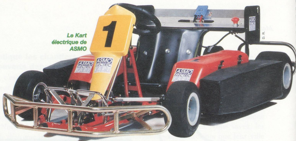
Le Kart électrique de ASMO