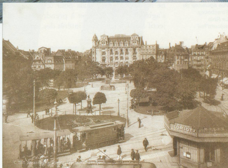
Le tramway aujourd'hui et hier

— En partie oui. Très tôt, j'ai souhaité pouvoir apporter ma part à l'amélioration de la vie quotidienne de la cité. Il fallait concilier cette ville avec notre temps et préparer les rendez-vous de demain. J'ai effectivement fait du développement de Strasbourg un de mes principaux objectifs pour redonner un haut niveau de performance à notre collectivité. Notre région et notre ville concentrent de véritables talents dans les domaines de la recherche, de la culture et de la formation notamment. Ces pôles d'excellence nous ont permis de remporter plusieurs succès comme