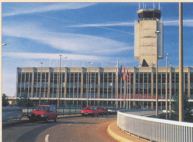
L'aéroport de Bâle-Mulhouse