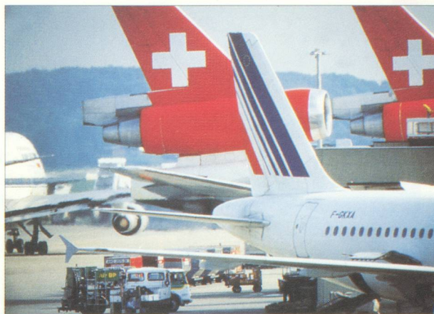
Aéroport de Genève.

« Le 3 avril dernier, le Conseil d'administration de Swissair a opté pour une nouvelle conception de l'horaire à compter de l'automne 1996, avec pour objectif de renforcer la compétitivité de la « plate-forme » Suisse et, parallèlement, d'améliorer la rentabilité de la compagnie aérienne. La stratégie de la plate-forme unique nécessite une concentration des vols long-courriers sur Zurich et l'instauration d'une « quatrième vague » dans les pointes de trafic de cet aéroport. En conséquence, tous les vols intercontinentaux - à l'exception des vols Genève-New York et Genève-Washington - seront regroupés à