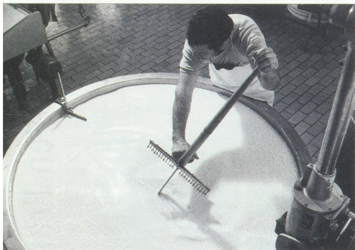
Fromagerie de Gruyère

Ce soixante quinzième anniversaire est l'occasion idéale pour découvrir quelques membres de la CCSF-Marseille Sud-Est Méditerranée