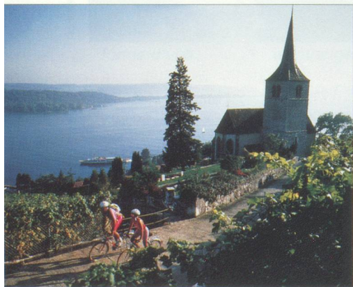
Parmi nos atouts : le caractère traditionnel de nos stations