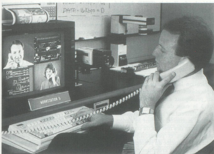
Photo : applications multimédia via SwissNet/RNIS.

fait florès. Quoi qu'il en soit, ce terme revêt des définitions et des interprétations très différentes. Il faut entendre par là à la fois des transmissions de données rapides et souples destinées aux entreprises et l'émergence de nouveaux services vidéos domestiques. Les services RNIS répondent d'ores et déjà aux critères d'une autoroute de l'information disponible à l'échelle mondiale ; ladite autoroute permettant de satisfaire pleinement aux besoins d'un utilisateur de PC. Toutefois, force est de constater que SwissNet est limité dans la transmission d'images animées. Au demeurant, Internet (réseau mondial créé à l'origine afin de répondre aux besoins de la recherche et des universités) n'est pas mieux loti si l'on choisit l'accès normal par le réseau téléphonique.