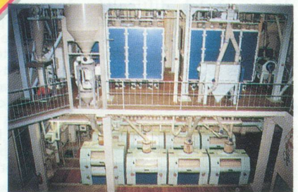
Moulin de Surgères, 200 t/24h