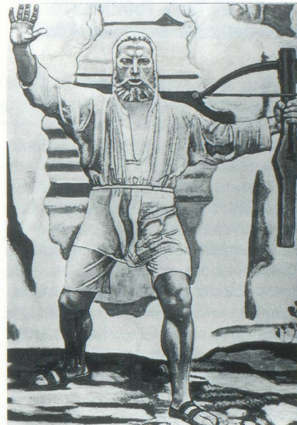
Guillaume Tell. Peinture de Ferdinand Hodler Musée des Beaux-Arts de Soleure

Il en a de la chance, le Gouvernement suisse : un peuple indifférent, des médias pleins de retenue, un Parlement récemment renouvelé où les novices sont nombreux. Nul ne le harcèle quand il négocie, le dos au mur, un accord bilatéral avec l'Union européenne. Personne ne parierait gros, en cette fin de novembre, sur une issue satisfaisante de ces tractations lancées il y a une année. Les mieux renseignés des journalistes en poste à Bruxelles envisagent une mise en sommeil prolongé d'une affaire mal emmanchée tournant au dialogue de sourds. Chacun campe, en effet, sur ses positions. À Berne, on prend la pose pour affirmer non sans bravade qu'on ne déplacera pas une virgule du mandat des négociateurs suisses. À Bruxelles, on affecte de ne rien entendre. Les Européens ont le temps pour eux, leur antichambre est vaste ; la Suisse peut s'y installer, elle ne sera pas seule. La Commission – pour important qu'elle tient l'établissement de bonnes relations avec la Suisse – a d'autres choses en tête. Elle n'est pas à l'origine de ces marchandages bilatéraux qu'elle ne prise guère. Elle ne perd aucune occasion de rappeler qu'elle avait offert aux États-membres de l'Association européenne de libre-échange