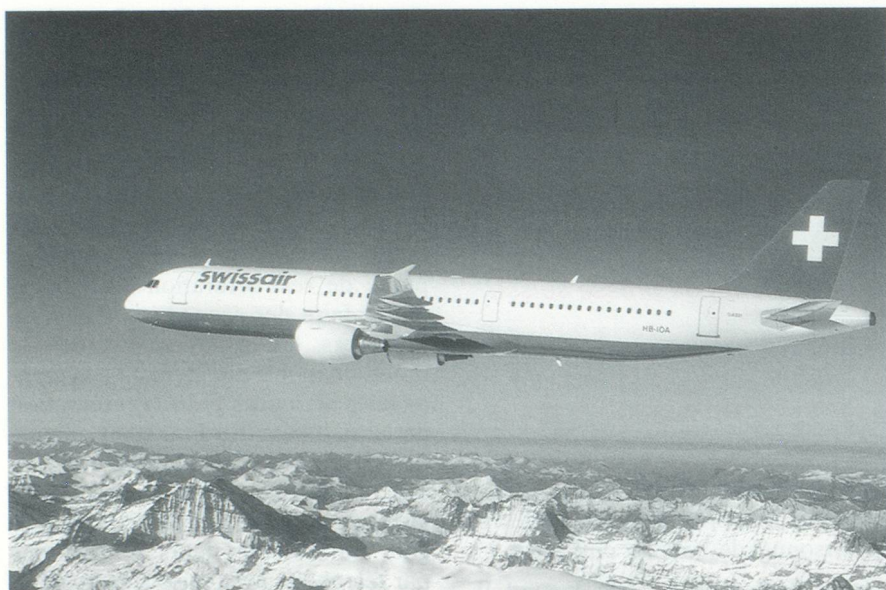
Airbus A321. Doté de 176 places, l'A321 est le fer de lance de la nouvelle flotte de Swissair pour l'Europe. La compagnie suisse introduit huit de ces appareils.

n'étaient pas au même endroit. Une politique similaire sera appliquée pour nos bureaux.