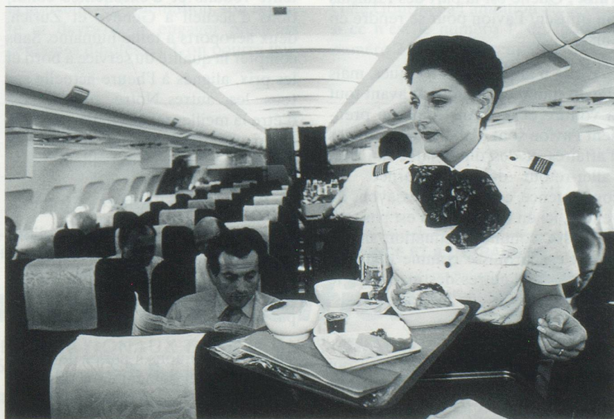
... « Swissair est certes une petite compagnie, mais son image de par le monde de même que l'étendue de son réseau comparées à la taille de la Suisse sont sans commune mesure... ». Photo : un repas servi à bord de l'A321. © Swissair.

Le réseau Swissair comprend 115 destinations dans 66 pays. Outre le trafic aérien proprement dit, les activités de Swissair s'étendent également à des services tels que l'organisation au sol et la maintenance des avions. Le groupe Swissair comprend en plus de la compagnie aérienne des activités de services et de catering (Gate Gourmet), des boutiques hors-taxes (Nuance Trading), des hôtels (Swissôtel), une société de fret aérien (Jacky Maeder AG), ainsi que d'autres petites participations. Ces divers domaines fonctionnent en tant que centres de profits autonomes. Swissair est actionnaire majoritaire dans la compagnie aérienne régionale Crossair.