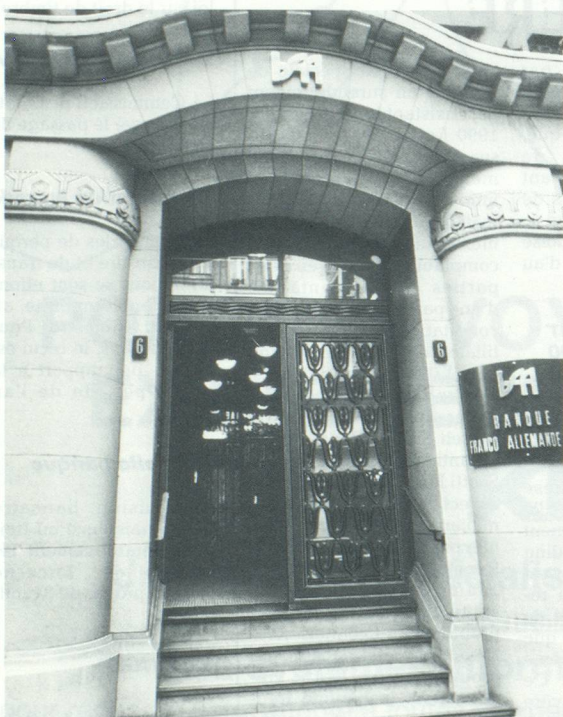
omium de publicité profil