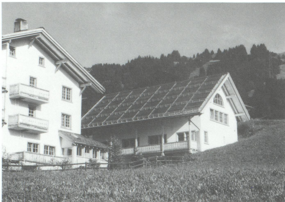
L'installation modèle de l'Hôtel Ucliva à Waltensburg (canton des Grisons) produit, avec environ 100 m 2 de capteurs solaires, la chaleur couvrant la consommation d'eau chaude des clients de l'hôtel.