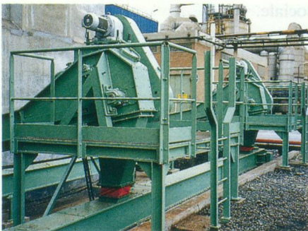
MANUTENTION MECANIQUE POUR LES PRODUITS EN VRAC CHARBON - CIMENT - PLATRE COPEAUX DE BOIS POUSSIÈRES...