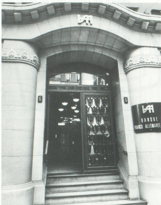
omnum de publicité prodi