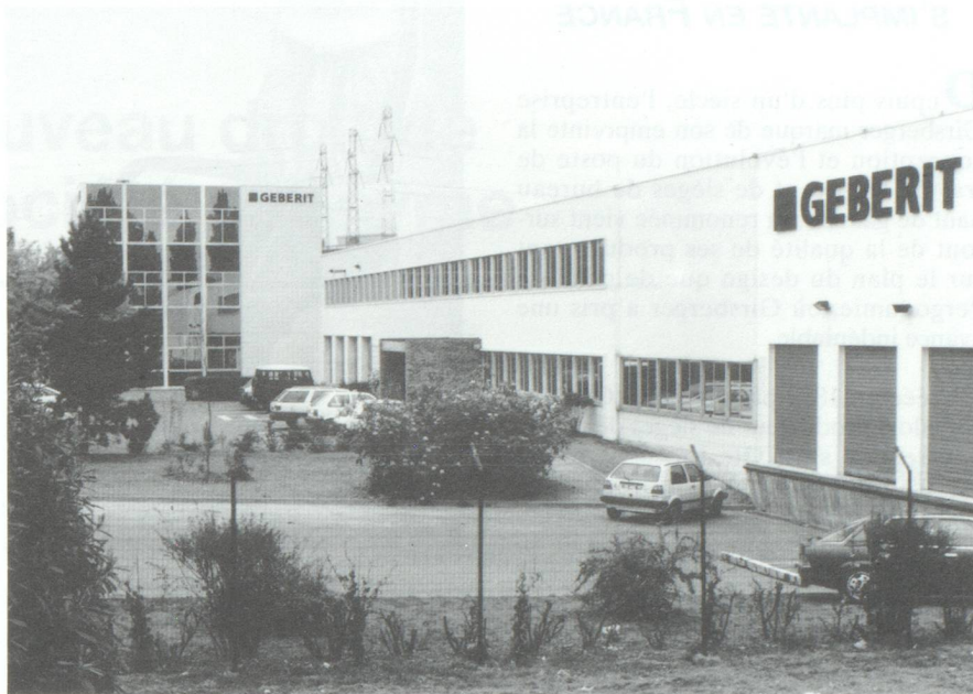
Nouveaux bâtiments de la Société Geberit Sàrl à Antony, dans le département des Hauts-de-Seine (France).

La palette des produits a connu également une extension déterminante : dans le domaine des tubes et raccords