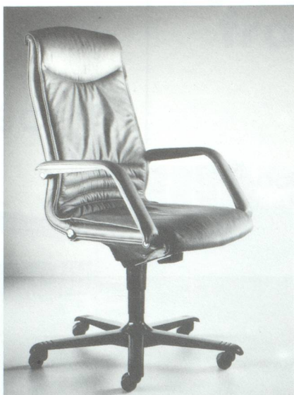
Photo : modèle Trilax 2 de luxe. Ce modèle combine une performance technique et ergonomique avec un grand niveau esthétique.

Le succès rencontré par ses produits sur le marché français a incité la société Girsberger à y implanter une succursale inaugurée au Printemps 1992. Une pré-