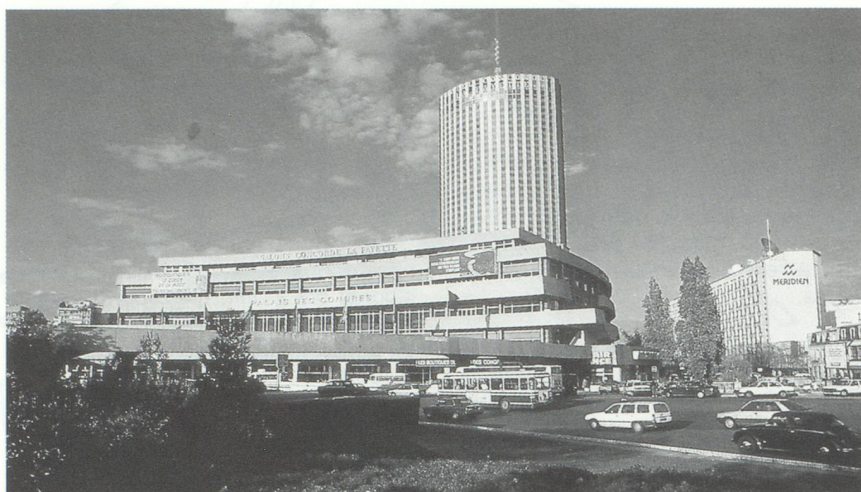
Le Palais des Congrès, Porte Maillot.

soit un chiffre d'affaires total de 5 227 750 000 F