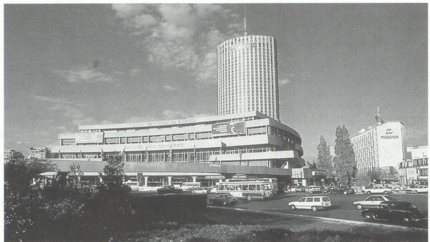
Le Palais des Congrès, Porte Maillot.

soit un chiffre d'affaires total de 5 227 750 000 F