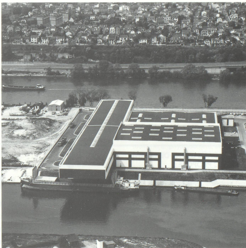
Entrepôts British Steel à Gennevilliers.

La voie d'eau est aujourd'hui en Ile-de-France la seule infrastructure capable d'acheminer les marchandises qui n'est pas saturée, qui est loin de l'être puisqu'elle pourrait acheminer sensiblement 3 fois plus de marchandises que ce n'est le cas. Voilà une bonne raison purement régionale et de bon sens de valoriser l'atout que représentent la voie d'eau et les plates-