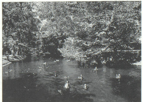
...« L'Ile-de-France, une région où la qualité de la vie est prioritaire »...

M ais la qualité des infrastructures et le développement des pôles ne seraient rien s'il n'y avait, derrière, les hommes. La qualité de la formation est donc aussi importante et l'Ile-de-France présente sur ce point des atouts non négligeables. Forte de ses dix-sept universités, elle regroupe plus de 55 % du potentiel national de recherche et accueille la plupart des grandes écoles. Pourtant la formation ne peut s'enfermer dans un élitisme qui ne répondrait ni aux aspirations du plus grand nombre désireux d'acquérir une bonne formation, source d'une carrière réussie, ni aux besoins d'une économie moderne qui demande de plus en plus de compétences.