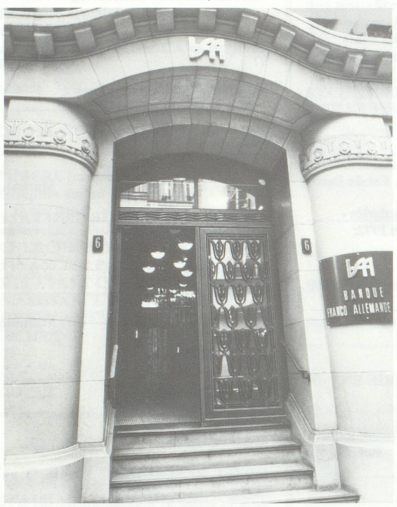
omnium de publicité proail