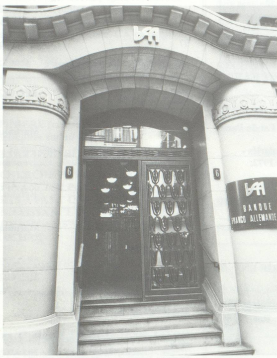
omnium de publicité proail