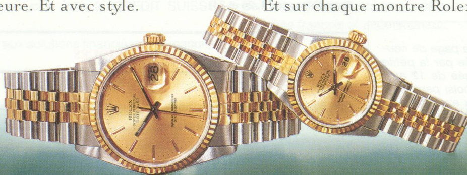
Rolex Datejust et Lady-Datejust. Chronomètres en acier et or 18 ct. avec bracelet jubilé assorti.