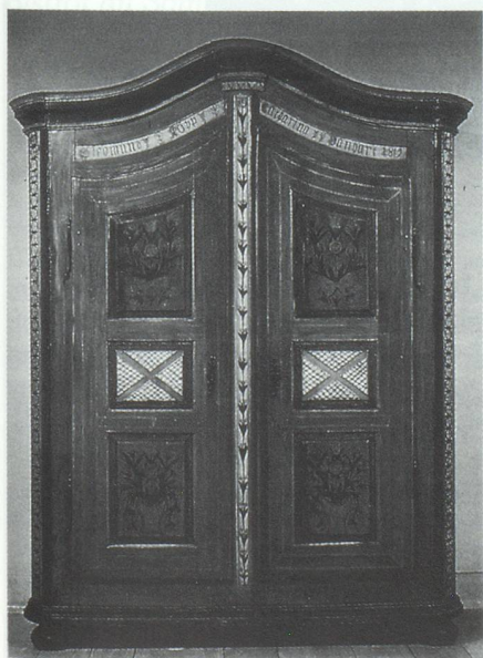
Armoire de mariage - Haut-Rhin (1819)

Se penchant sur le cas de l'horloge comtoise et du buffet briard, l'exposition et le maniable catalogue qui l'accompagne, s'interrogent également sur l'association très étroite qui souvent existe entre un meuble et une région. "Comment, en effet, la chaise alsacienne, le lit clos breton, le coffre basque, l'armoire normande, la panetière provençale et son pétrin, sont-ils devenus - parmi tant d'autres meubles tout aussi spécifiques à ces régions - des meubles marqueurs d'identité régionale ?".