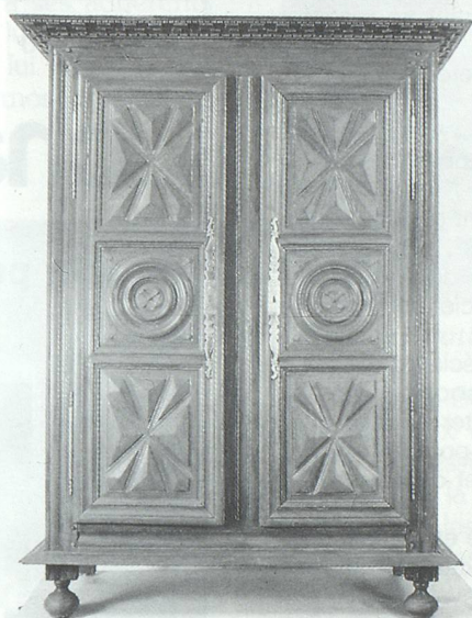
Armoire en châtaignier - Loire-Atlantique (XIX e siècle)

Il pourra de même vérifier l'influence majeure des styles aristocratiques ou bourgeois des XVIIe et XVIIIe siècles sur la production régionale, mais aussi le décalage chronologique, souvent important, entre l'apparition de ces styles et leur adoption par les classes rurales. Si l'observation directe du mobilier de l'église, de la riche demeure citadine ou du château voisin constitue pour les artisans