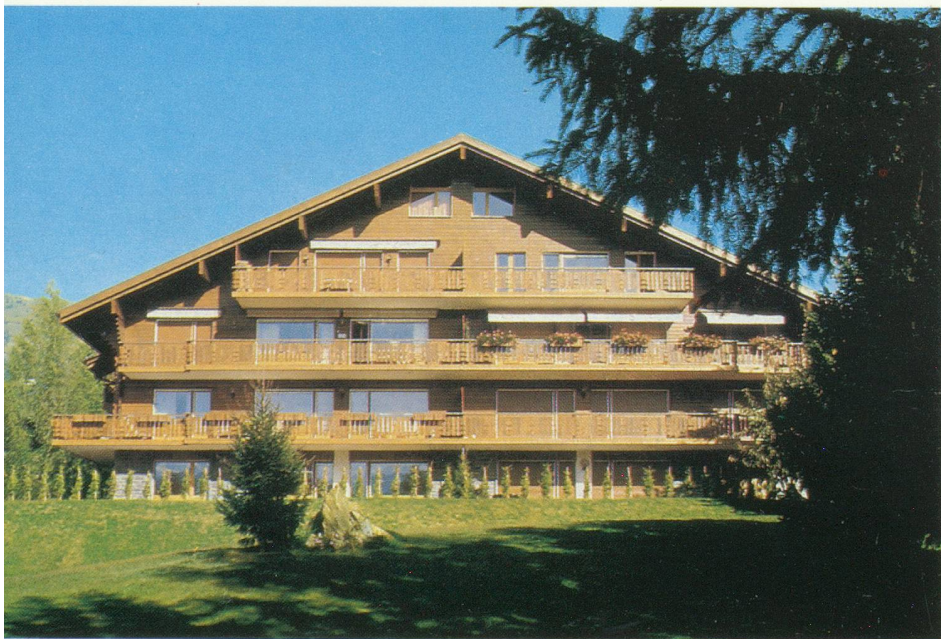
St Andrews, un chalet de 8 appartements, construit par Gaston Barras