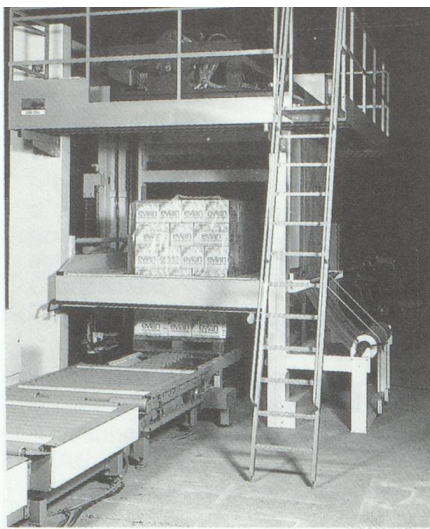
Suremballage des charges palettisées sous film rétractable. Photo : Suremballeuse intégrale Uni-Pal® Thimon, Aix-les-Bains.

Suivent quelques rubriques à petits chiffres : balances, ensacheuses, étiqueteuses, etc.