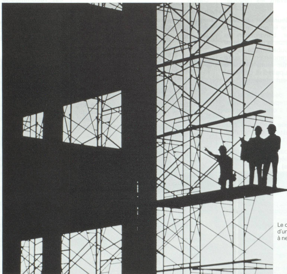
Le conseil d'un expert, un atout à ne pas négliger.

En général, toute relation gagne à être poursuivie. Les relations bancaires ne font pas exception à cette règle.