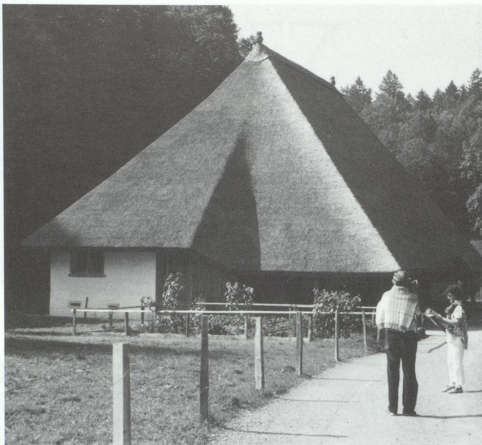
Maison paysanne Oberentfelden/AG

Grâce à l'infrastructure dont dispose un Musée de plein air, il est possible de