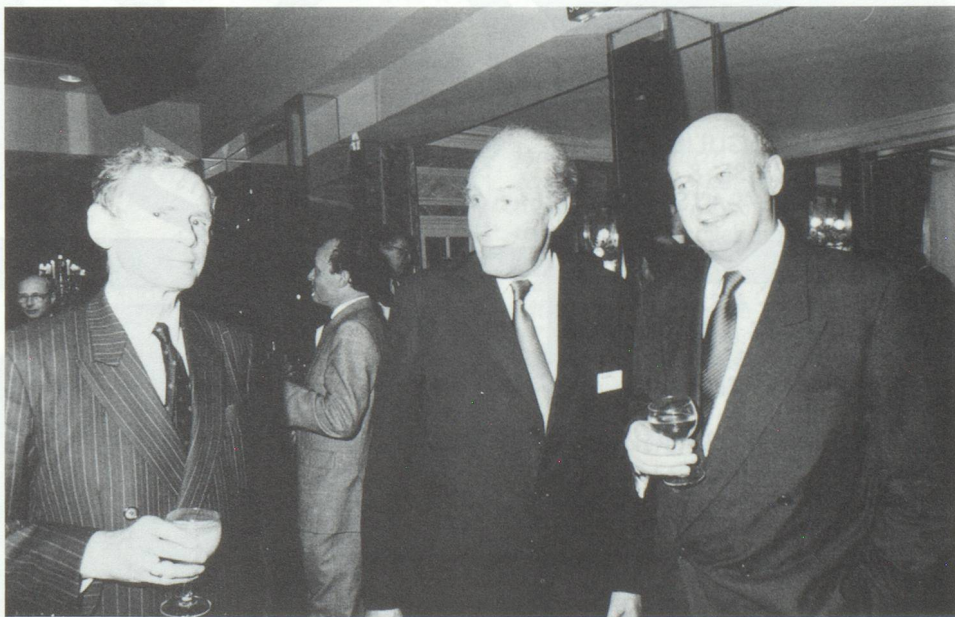
Photo : Réception donnée par le Groupe Sulzer France, en automne dernier, au Pavillon d'Armenonville, à l'occasion du 70 e anniversaire de sa présence en France.

La Fondation a pour vocation de défendre la qualité des produits européens en organisant des échanges d'expériences entre les entreprises membres et projette de créer une « garantie » (label) de qualité européenne.