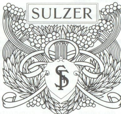
Extrait d'une couverture de publicité SULZER PARIS 1918.

En 1987, Sulzer a réalisé près de la moitié de son chiffre d'affaires dans le chauffage et la climatisation (19,9 %) et dans les machines à tisser (23,4 %) où il occupe la place de premier constructeur mondial.