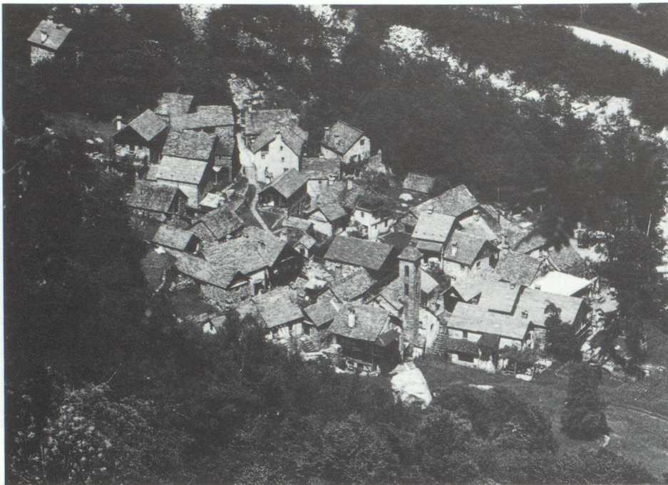
Foroglio dans le val Bavona, une transversale du val Maggia/Tessin.

Habitat compact avec les toitures typiques en ardoises du Tessin, au pied d'une cascade. Le val Maggia et le val Bavona offrent aux alpinistes et aux promeneurs une infinité d'itinéraires intéressants.