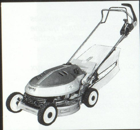
Tondeuses d'avant-garde avec ...