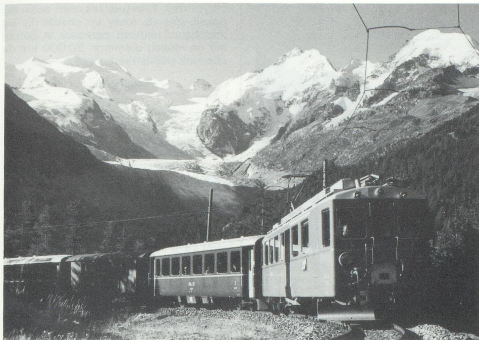
... Une formation du Bernina-Express, sur une partie de la voie ferrée la plus haute d'Europe...

fédéraux suisses (CFF) et les chemins de fer privés sont complètement électrifiés ; leur réseau d'environ 5 000 km comprend 3 600 km à voie normale et 1 400 km à voie étroite. Le matériel roulant a été renouvelé en majeure partie au cours des dernières années. Les grandes voies de communication à travers les Alpes – lignes du Saint-Gothard, du Simplon et du Lötschberg – assurent aujourd'hui un trafic de pointe très dense.