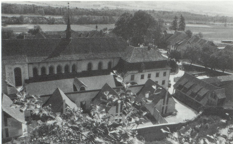
La Chartreuse d'Ittingen, transformée en centre culturel.

C'est-à-dire, en d'autres termes, que le développement du tourisme en Thurgovie est quelque peu limité. Le paysage grandiose et l'infrastructure nécessaire pour satisfaire la grande foule cherchant le repos en sont absents. Toutefois le canton offre aux touristes pédestres, aux cyclistes, aux cavaliers – pour autant que ceux-ci respectent la nature – des conditions idéales. La Thurgovie se prête très bien à une excursion d'un jour, non seulement au bord du lac, mais à l'intérieur des terres qui offrent toute une palette de possibilités. Il y a en abondance des endroits attrayants, des châteaux et des ruines célèbres en Suisse, des paysages protégés, des ruisseaux magnifiques et des cours de rivières de toute beauté, sans oublier un nombre impressionnant de