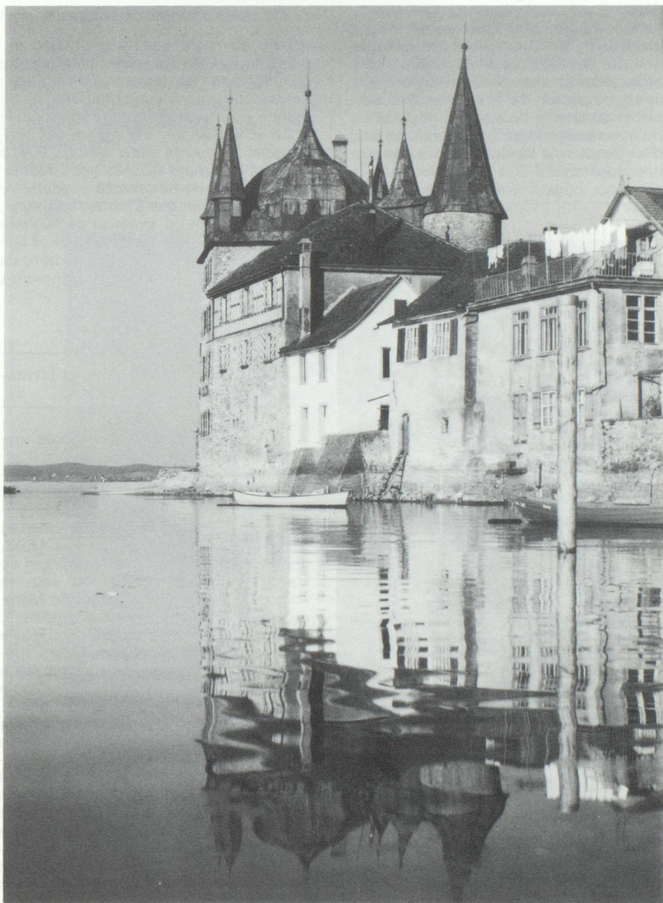
Ville de Steckborn, au bord du Lac Inférieur.

leurs nos voisins du nord l'appellent volontiers la mer souabe. Les romains avaient avec Arbor Felix, le nom actuel d'Arbon, un atout important. Mais cela ne suffit pas tout à fait pour un canton touristique. Pour les Suisses le canton est situé au nord-est, c'est-à-dire exactement à l'opposé : la passion des vacanciers est dirigée vers le sud. Et pour les sports d'hiver il offre très peu, pour ainsi dire presque rien – tout au plus le lac est gelé de temps à autre, mais cela ne suffit pas pour attirer des