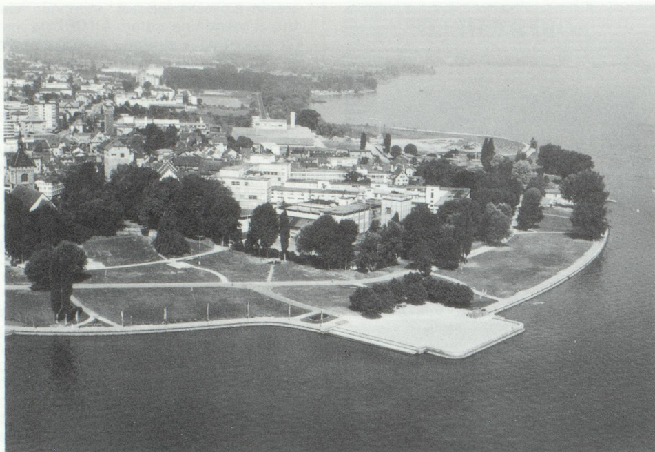
...La Thurgovie : un canton champêtre hautement industrialisé et fortement orienté vers l'exportation (Photo ci-contre : Arbon, ville industrielle sur le Lac de Constance).

vestimentaire. L'industrie mécanique suivit rapidement. Textiles et vêtements avaient, il y a peu de décennies encore, une place prédominante. Aujourd'hui ils sont dépassés par l'industrie mécanique et les appareils industriels. En outre, l'industrie de l'alimentation est fortement implantée. Elle se sert surtout des produits agricoles. Un certain nombre de secteurs de l'industrie du bois sont également fortement représentés.