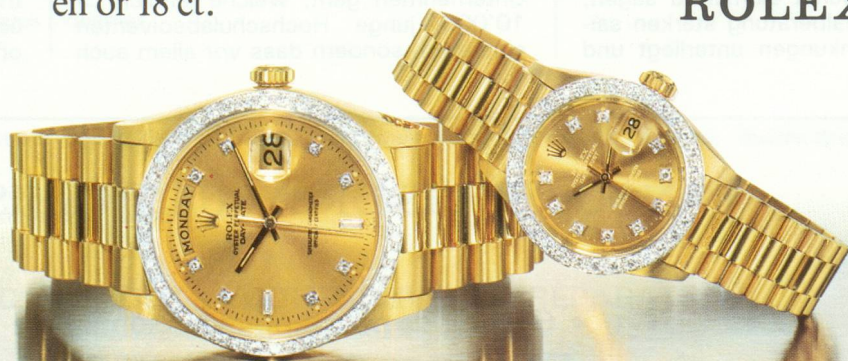
Les chronomètres Rolex Day-Date (en 25 langues) et Lady-Datejust en or 18 ct., sertis de diamants