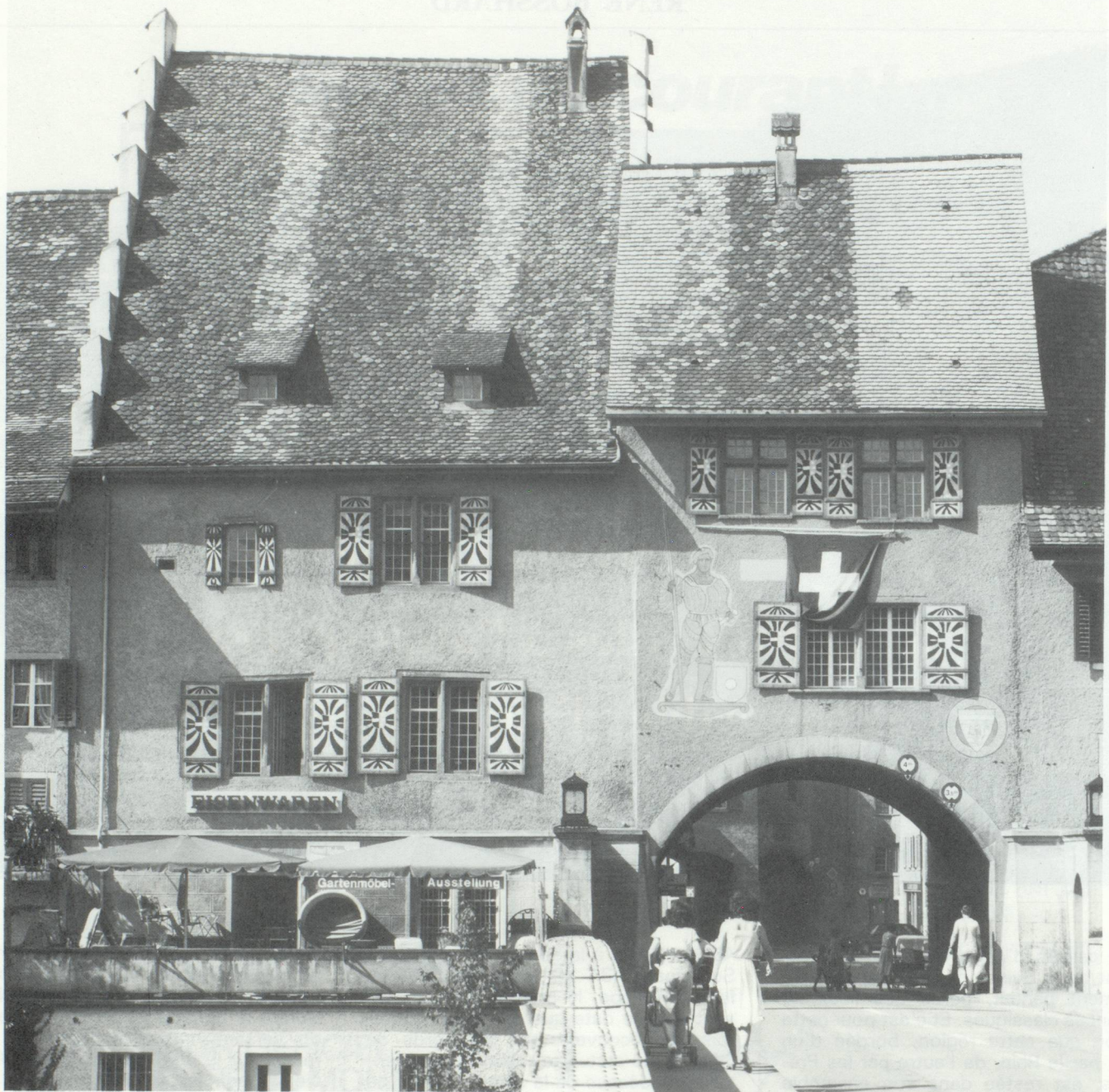
Melligen, petite bourgade pittoresque sur la Reuss (une des plus grandes rivières de Suisse), fondée en 1240 par les Comtes de Kybourg (doc. ONST, Paris).

11 villes historiques (Aarau, Brugg, Zofingen, Lenzburg, Bremgarten, Baden, Klingnau, Kaiserstuhl, Melligen, Rheinfelden et Laufenburg), c'est-à-dire les « grands classiques » du tourisme argovien, qui fascineront tous ceux que l'histoire intéresse. Toutes ces vieilles villes, particulièrement bien restaurées, impressionneront non seulement par la diversité de leur architecture, mais aussi par leur pittoresque et leur propreté. A titre d'exemple, Laufenburg am Rhein a obtenu en 1985 le « Prix Wakker » décerné par l'Office Suisse de la Protection des Sites, pour avoir su conserver son image d'une façon historique et exemplaire.