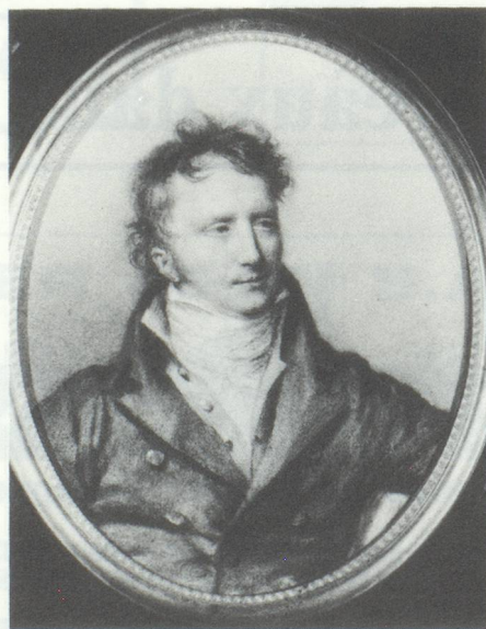
Benjamin Constant, né à Lausanne (1767-1830).

Cette terre de climat équilibré, prospère et de vie facile ne pousse pas aux grands défis historiques et à l'épopée. Les Burgondes qui s'y sont établis se sont fondus avec une élégante discrétion dans la population gallo-romaine, n'ayant ni l'insolence conquérante des Francs, ni la ténacité taciturne des Alamans aux petites communautés coriaces. On voit ainsi les Vaudois, latins de langue et relevant politiquement du Saint-Empire germanique, participer à l'éphémère Lotharingie, qu'encadrent dans le temps deux royaumes de Bourgogne à l'histoire fugace. Les dynastes de Savoie, à cheval sur les Alpes, de Chambéry à Turin, trouvent dans le Pays de Vaud un prolongement naturel de leur État. Ils y dominent trois siècles dans la mesure où les théâtres extérieurs n'accaparent pas leurs forces et