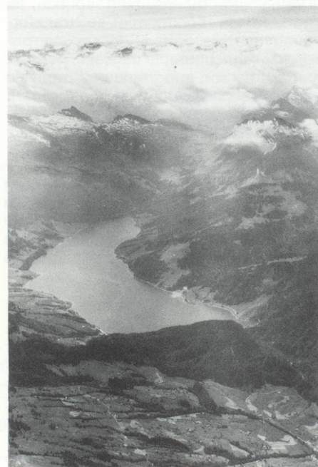
Lac de Wägital.