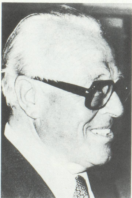
M. Pierre Graber, Ancien Président de la Confédération helvétique.