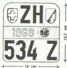
Plaques de contrôle pour motocycles