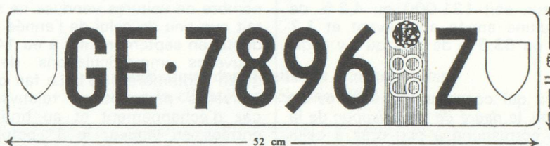
Plaque arrière pour voiture automobile non dédouanée